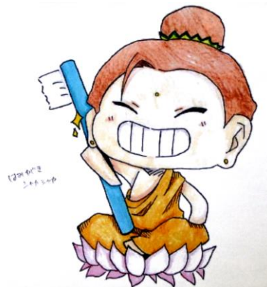
決定した「釈迦シャカ」