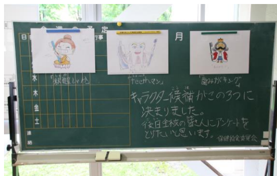
昇降口での候補作品の掲示