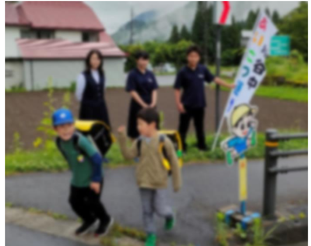
小学生も元気にあいさつをかえしてくれます

スローガンにしているので、地域を大切にしたいと考え、小学生や地域の方にもあいさつできる国道との交差点付近で、安全に配慮しながら行っています。実施日は毎朝火曜日と木曜日の7時25分～7時40分。通年で実施する予定です。活動を見かけましたら、声をかけていただくとありがたいです。