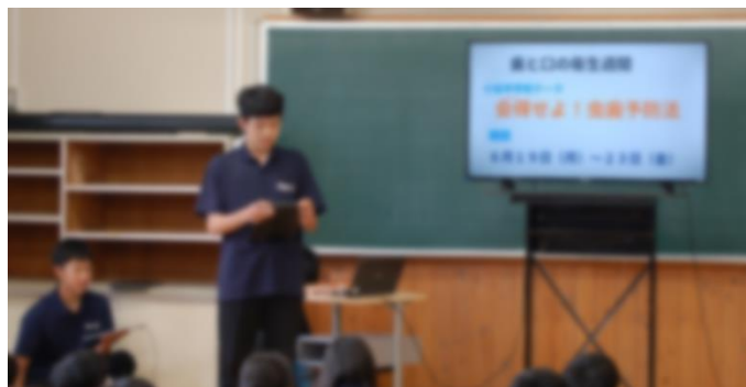
生徒会役員が全校を仕切って進行

また、「歯と口の衛生週間」についても提案がありました。グループをつかって、タブレットやホワイトボードを使いながら、虫歯予防と現状について話し合